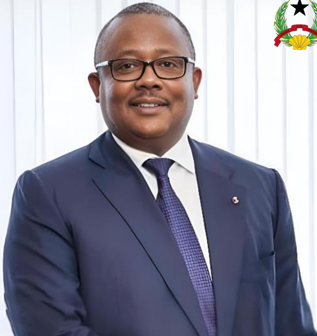
S.E. UMARO SISSOCO EMBALÓ, Presidente da República da Guiné Bissau

« O sector privado desempenha um papel essencial na realização dos Objectivos de Desenvolvimento Sustentável e da Agenda 2063. Para atingir estes objectivos, é crucial mobilizar o financiamento necessário para apoiar as empresas privadas no seu crescimento e na sua contribuição para a economia da Guiné-Bissau. »