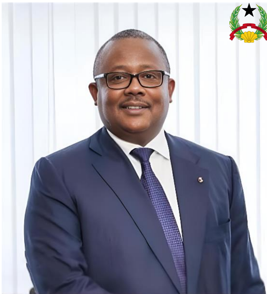
S.E. UMARO SISSOCO EMBALÓ, Président de la République de Guinée Bissau

« Le secteur privé joue un rôle essentiel dans la réalisation des Objectifs de Développement Durable et de l'Agenda 2063. Pour atteindre ces objectifs, il est crucial de mobiliser les financements nécessaires pour soutenir les entreprises privées dans leur croissance et leur contribution à l'économie de la Guinée Bissau »