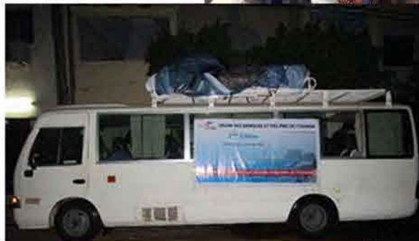
Le car de la caravane.

Ensemble, créer, développer et promouvoir les PME créatrices de richesse et d'opportunités