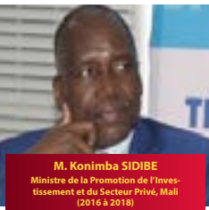
M. Konimba SIDIBE Ministre de la Promotion de l'Investissement et du Secteur Privé, Mali (2016 à 2018)