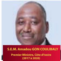
S.E.M. Amadou GON COULIBALY Premier Ministre, Côte d'Ivoire (2017 à 2020)