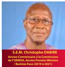
S.E.M. Christophe DABIRE Ancien Commissaire à la Commission de l'UEMOA, Ancien Premier Ministre / Burkina Faso (2019 à 2021)