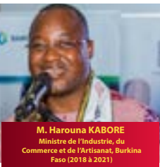
M. Harouna KABORE Ministre de l'Industrie, du Commerce et de l'Artisanat, Burkina Faso (2018 à 2021)