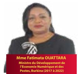
Mme Fatimata OUATTARA Ministre du Développement de l'Economie Numérique et des Postes, Burkina (2017 à 2022)