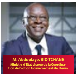
M. Abdoulaye BIO TCHANE Ministre d'Etat chargé de la Coordination de l'action Gouvernementale, Bénin