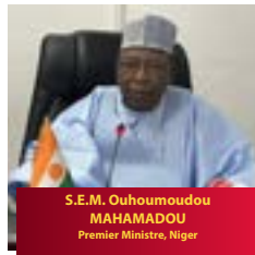
S.E.M. Ouhoumoudou MAHAMADOU Premier Ministre, Niger