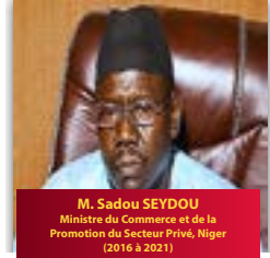
M. Sadou SEYDOU Ministre du Commerce et de la Promotion du Secteur Privé, Niger (2016 à 2021)