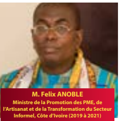
M. Felix ANOBLE Ministre de la Promotion des PME, de l'Artisanat et de la Transformation du Secteur Informel, Côte d'Ivoire (2019 à 2021)