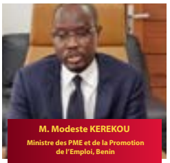
M. Modeste KEREKOU Ministre des PME et de la Promotion de l'Emploi, Bénin