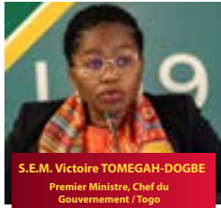
S.E.M. Victoire TOMEGA-DOGBE Premier Ministre, Chef du Gouvernement / Togo