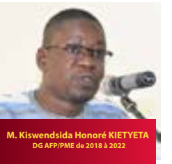
M. Kiswendsida Honoré KIETIYETA DG AFP/PME de 2018 à 2022